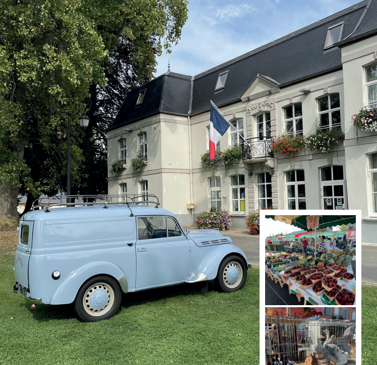
Mairie d'Audruicq et son marché du mercredi matin