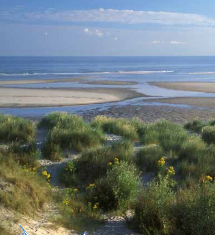
Réserve Naturelle Nationale du Platier d'Oye